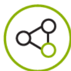
Consultoría e Ingeniería