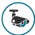
Seguridad y Control

Desde los servicios de soluciones tecnológicas que ofrecemos en FQ TECNOLOGÍA, resolvemos diferentes necesidades en el ámbito comercial y corporativo con estas líneas de negocio: